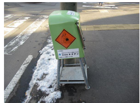
【滑り止め 砂箱の設置】