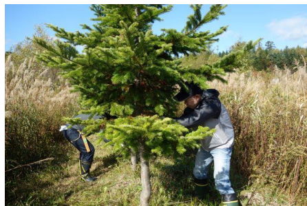
【植樹。育樹活動への参加】