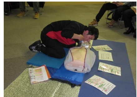
【救命救急講習を実施】